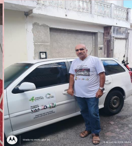
ADESIVO: CARRO E CAMISA